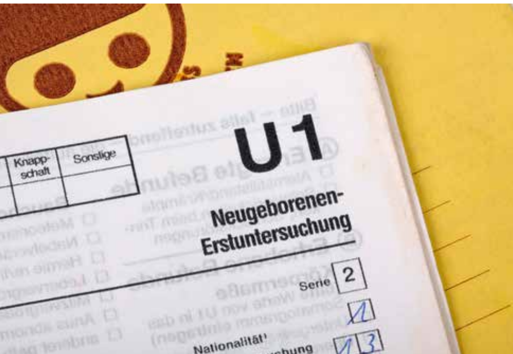
Gelbes Vorsorgeheft alte Ausführung

Zum 01.09.2016 sind u. a. die neun U-Untersuchungen (und die J1-Untersuchung) bis zum Schulalter neu gefasst und in Teilen auch erweitert worden. Die Dokumentation in dem sogenannten „Gelben Heft“ wurde umstrukturiert und mit einer sogenannten Teilnahmekarte versehen.